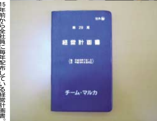
15年前から全社員に毎年配布している経営計画書。朝礼で繰り返し読み、方針を徹底させる。