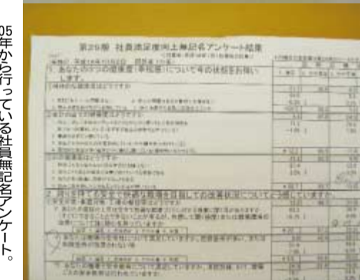
05年から行っている社員無記名アンケート。社員の意見を事業に反映させている。