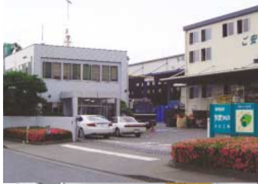
清掃が行き届いたエコネコル本社工場。

いい会社にしたい。そうした佐野社長の本気が様々な方針に表れている。いい会社には人はずっと集まってくる。あの会社と一緒に仕事がしたい。そうした業務提携や資本提携も増えていく筈である。佐野マルカは大きな時代の流れの中、エコネコルとして生まれ変わった。同社は「経済」と「環境」を両立させるE&E事業を次々と創業し、持続可能な社会の実現に貢献していく方針である。